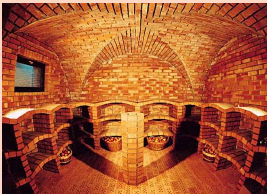
κελάρι κρασιών κατασκευασμένο από ανακυκλωμένα τούβλα

Η Ευρωπαϊκή Επιτροπή καταρτίζει κανόνες για την αποφυγή της μόλυνσης του εδάφους, των υπογείων νερών ή των επιφανειακών νερών, που οφείλεται σε υλικά επιχωμάτωσης. Αλλά καθώς τα κεραμικά οικοδομικά υλικά είναι κατασκευασμένα από φυσικό πηλό, δεν δημιουργούν κίνδυνο στο περιβάλλον.